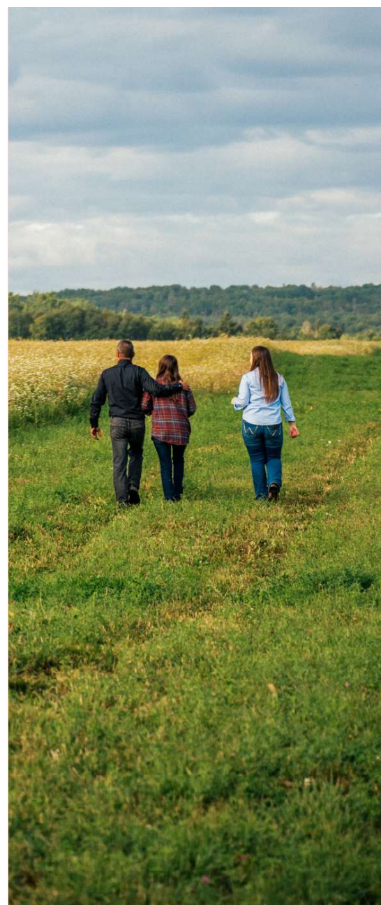
Figure 3 : PDZAA 2025-2030 – Agriculture et agroalimentaire écoresponsables : axes, objectifs et actions